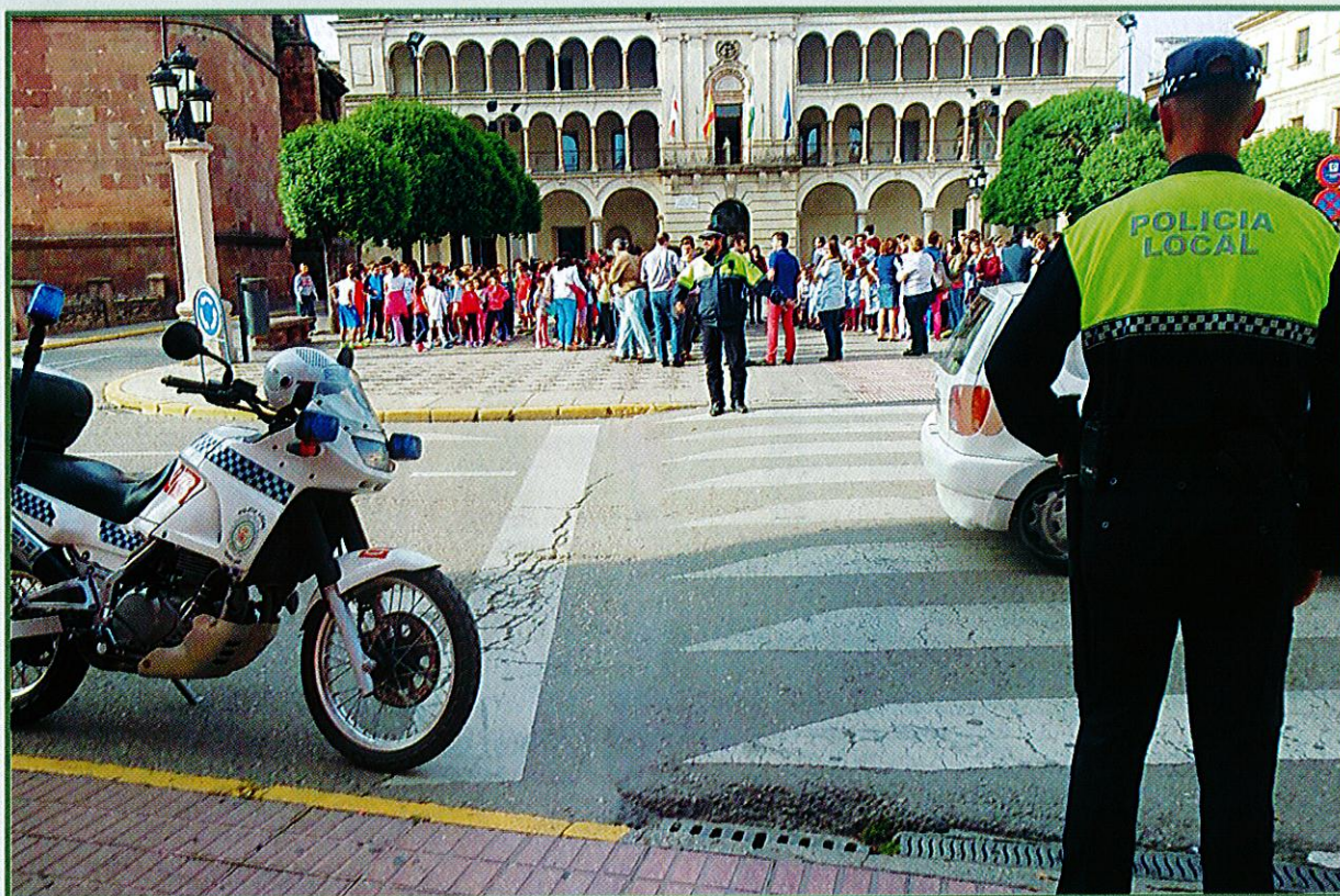
Agentes de la Policía Local de Andújar controlan el tráfico en la Plaza de España, durante una actividad con escolares.