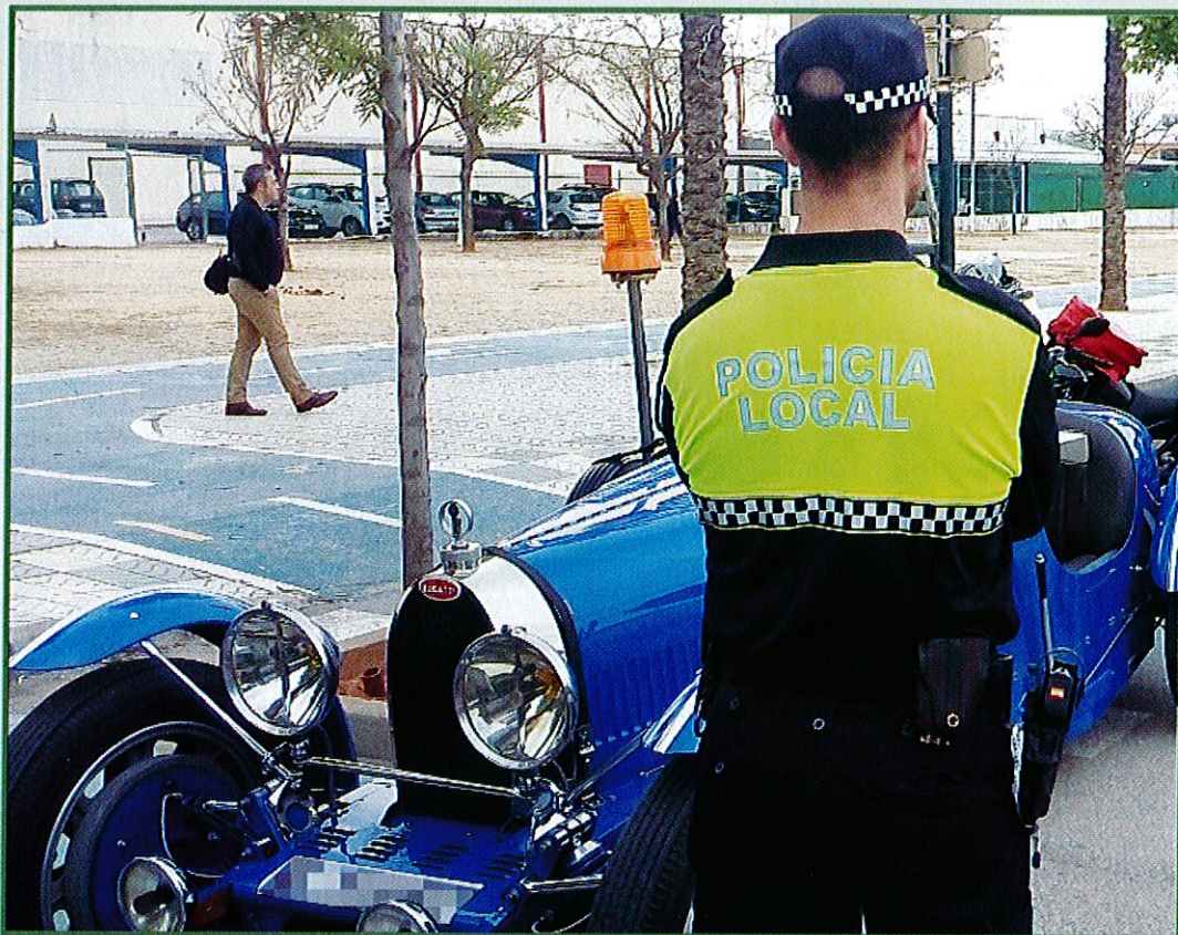
La Policía Local garantiza la seguridad en eventos, actividades y pruebas deportivas que se desempeñan en la ciudad.

Con respecto a los niños, desde la Jefatura impulsan campañas de educación vial, en coordinación con la Concejalía de Educación, para intentar enseñar el comportamiento cívico que deben de tener los niños como peatones, y además que